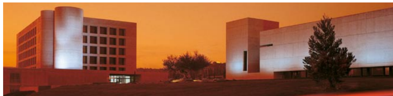
CECIDA TURISMO DE NAVARRA

Vicepresidente 2º y consejero de Economía del Gobierno de Navarra