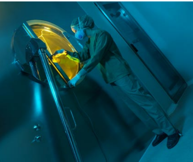
DIVERSIDAD. De izda. a dcha., un trabajador de Laboratorios Cinfa y otro del CENER. Debajo, interior de la sede de Biko. A su lado, vista aérea de la Avenida de Carlos III pavimentada por Obenasa, y tubos de ensayo de Idifarma.