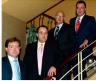
DIARIO DE NAVARRA