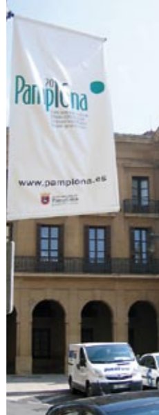
APUESTAS. Cartel anunciando la futura candidatura a ser Capital Europea de la Cultura en 2016. Abajo, participantes en un “Punto de encuentro” de la CAN sobre discapacidad.

SOCIEDAD Diferentes indicadores atestiguan que la población navarra y pamplonesa disfrutan de calidad de vida. Así, el PIB por habitante en la comunidad foral fue de 24.761 euros en 2005, situándose en el 119,6% de la media de España. Además, el 73,1% de los hogares disponen de ingresos entre medios y altos (que son estables para el 90%), el 50% tiene la